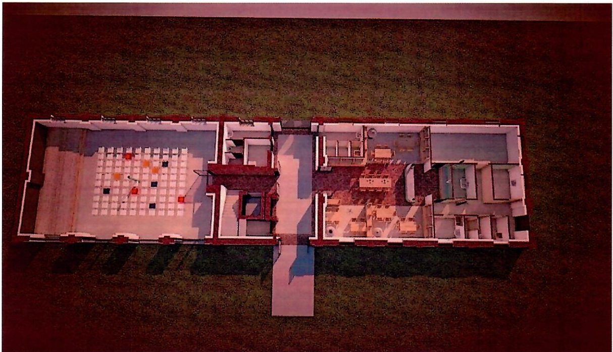
Wizualizacje: MS Studio Monika Szczelbawska